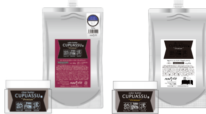
カラーバタープレミアム 200g@1680/店販@2800 900g@4000