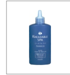
薬用エマルジョンクレンズ

●乾性頭皮用クレンジング。頭皮をマイルドなエマルジョンでマッサージすることで、スッキリと皮脂や汚れを落とします。