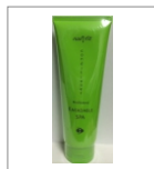
薬用HS コンディショナー

●ハーブの効いた薬用コンディショナー。フケ・カユミを抑え、毛髪にうるおいを与え、頭皮を健やかに保ちます。