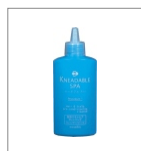
薬用プレクレンズ

●万能型クレンジング。ヘッドスパ・マッサージの初期段階で頭皮のコンディショニングを整え、同時に汚れをやさしく浮かせ、ニードブル・スパのファーストステップとして、とても重要な工程です。