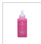
薬用アクティベーター

●育毛・毛生用ローション。ニーダブル・スパ技法と併用することで、育毛と頭皮の美容効果を目指した薬用スキャルプローション。アンチエイジング効果あり。