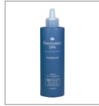
薬用オイルクレンズ

●脂性頭皮用クレンジング。エモリエント効果を与えながら、毛穴の余分な油や汚れを溶かし出し、ニオイを除去します。