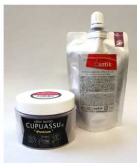
■左: カラーバター200g(全12色+クリアー) 右: チャンティック180g(全12色+クリアー)