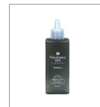
薬用カームフィニッシュ

●カームフィニッシュは、ニーダブルスパの仕上げを行う薬用スキャルプローション。頭皮を落ち着かせ、やさしくコンディショニングします。「EPC」配合